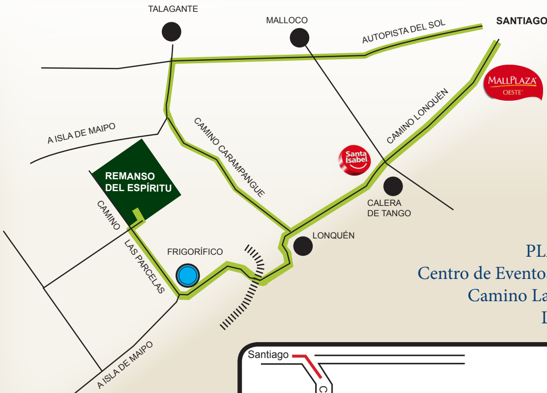
PLANO DE UBICACIÓN Centro de Eventos Remanso del Espíritu. Camino Las Parcelas. Parcela N°2. Lonquén, Isla de Maipo.

Si vienes del sur (en auto) debes tomar la salida Calera de Tango hacia el Oeste y debes seguir el mismo camino hasta la Copec con Santa Isabel, como se ve en el segundo mapa.