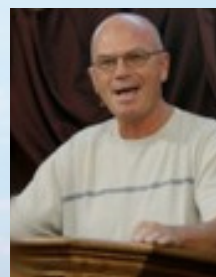
Por Bob Faller

La próxima vez que necesite recordar la grandeza de nuestro Dios, vaya al mar, mire hacia abajo y observe la arena; y al hacer esto contemple el decreto perpetuo que el Dios Todopoderoso decretó. Cuando lo hagamos, nos alegraremos en su majestad y en el amor que tiene para todos nosotros.